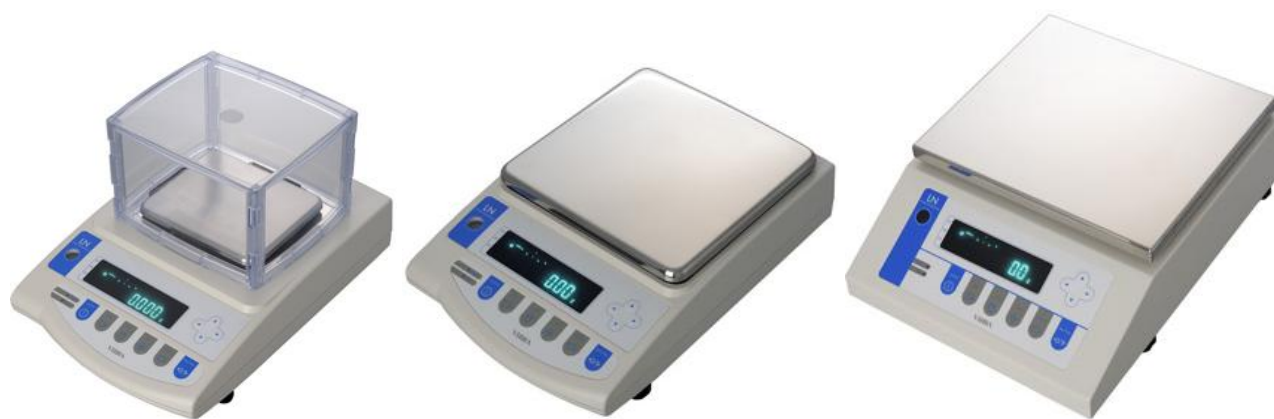
Рисунок 1 – Общий вид весов неавтоматического действия LN

Принцип действия весов основан на преобразовании частоты вибрации акустического весоизмерительного датчика, возникающей при его деформации под действием взвешиваемого груза, в цифровой электрический сигнал, изменяющийся пропорционально массе взвешиваемого груза. Результаты взвешивания выводятся на дисплей.